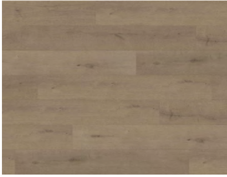
Vista | Vista 8200DS