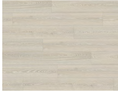
Aspect | Aspect 8201DS