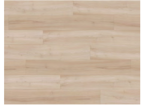
Dreamy | Rêveuse 8205DS