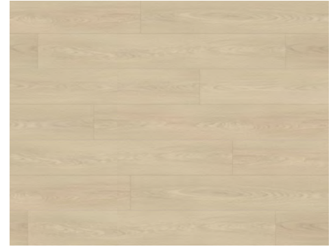
Facet | Facette 8202DS