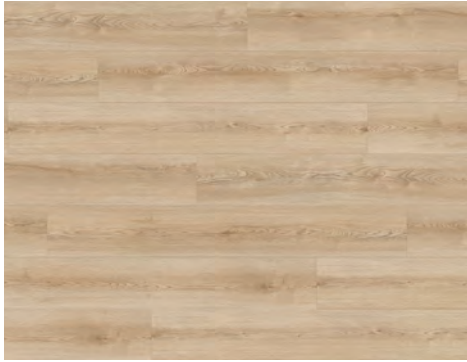
Lustrous | Brillant 8203DS