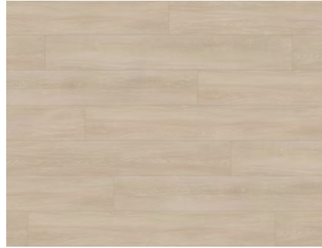
Airy | Aérée 8204DS